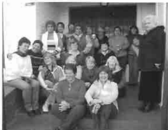
Reunión del Comité Permanente del Ministerio de la Mujer en Gualeguaychú, en junio.

En el Ministerio de la Mujer sabemos que al servir a la mujer resulta bendecida toda la familia. ¡Dios las bendiga!